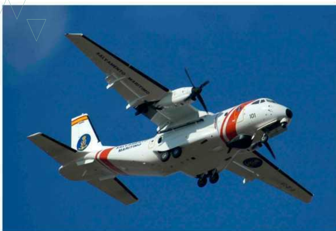
Avión EAD S CASA CN-235/300